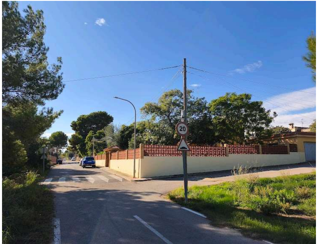
Marca solo un óvalo.

Incluye los espacios de uso residencial, los cuales se refieren a los núcleos urbanos y a la presencia de algunas viviendas unifamiliares diseminadas.